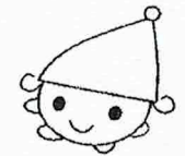
ネバーランド マスコットキャラクター 「ねばびび」