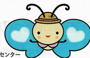
札幌市介護予防センター イメージキャラクター“かよるん”