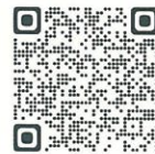
東区土木部ホームページ QRコード

また、東区土木部のホームページにも上記の情報を掲載しておりますので、ぜひご覧ください。