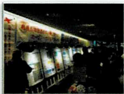
過年度のオープンハウスの様子

幅広い方々のご意見をいただくため、空港周辺地域のほか、市中心部での開催も検討しています。詳細は決まり次第ニュースレターでご案内いたします。