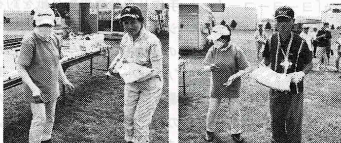
▲表彰式で手作りのメダルと賞品を受け取る優勝者と準優勝者の方々