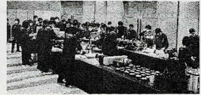
ホテルでのビュッフェ

5月23日・24日に私たち2学年は、小樽・ニセコへ宿泊学習に行ってきました。当日に向け、学年協・各委員会が中心となって、準備を進めていきました。また班の中の話し合いで、自分たちで進んでルートを決めることができました。宿泊学習中の自主研や、学年レク、体験学習などを通して、クラスや班、学年全体の仲を深めることができました。そして、笑顔の絶えない楽しく学びの多い宿泊学習でした。ですが、この宿泊学習で見えてきた課題もあります。それは、学級の仲間や先生に注意されてから切り替えるということです。2年生として1人で切り替えが出来るよう、学年全体で意識すると、よりよい学年になると思います。この宿泊学習で経験したことや反省を生かし、これからの学校生活も頑張っていきます。