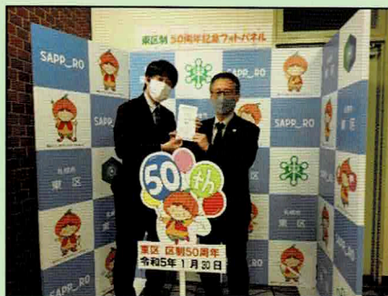
イトーヨーカドー労働組合札幌支部 様