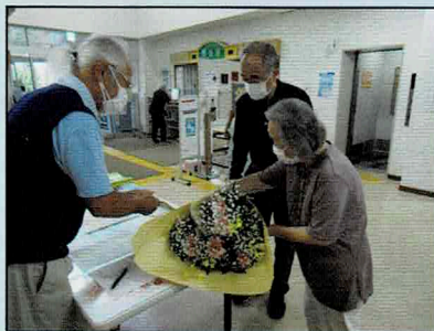
町内会への花束受け渡し

また、今までの事業実施経験から、町内会（参加は任意）への支援として、対象者への記念品（菓子）贈呈のお手伝いも行っています。