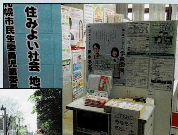
(写真) 活動強化週間の取り組み

毎年5月には「活動強化週間」として活動のPRを行っています。今年度は、イオン札幌元町ショッピングセンター等の店舗や区役所などで実施しました。