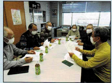
事務局会議の様子

伏古本町地区福まちは、苗穂本町地区センター内に事務所を構えており、福まち事業に関することは2か月に1回開催している事務局会議で打ち合わせを行い実施しています。コロナ禍ではありますが、地域の方々とのつながりを絶やさぬように…と考え、感染予防対策や開催時期、事業内容を検討しています。