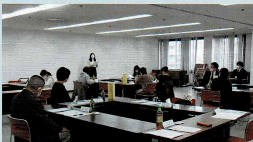
(写真) 主任児童委員の研修会の様子

「民生委員」は、民生委員法に基づいて厚生労働大臣から委嘱された非常勤の地方公務員です。ひとり暮らしの高齢者などのお宅を訪問し、安否を確認するなどの見守り活動や、生活・福祉全般に関する相談・援助活動を行っています。また、すべての民生委員は児童福祉法により「児童委員」も兼ねており、子どもに関わる相談や支援も行っています。