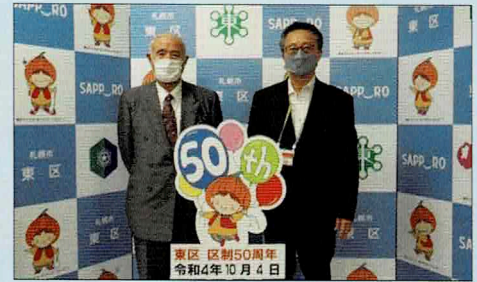
朝妻 与一 様