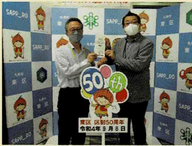
イトーヨーカドー労働組合 札幌支部 様