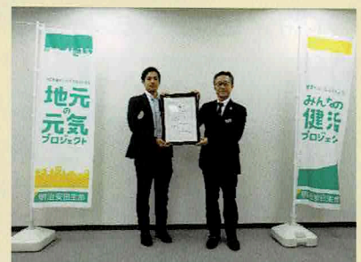
明治安田生命保険相互会社 札幌支社 様

***** 皆さまから頂いた善意は、地域の福祉活動（地域の見守り活動や孤立をしない地域づくり）に有効に活用させて頂いております。皆さまからのお申し込みをお待ちしております。