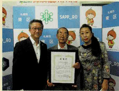
札幌市東区文化団体協議会 様