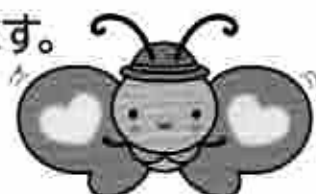
札幌市介護予防センター イメージキャラクター「かよるん」