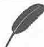
赤い羽根共同募金