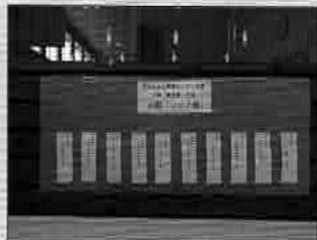
<優秀賞作品の展示の様子>

コロナ禍で変わってしまった日常をおもしろ川柳にしてみなさんで笑い飛ばしてもらえよう、第2層生活支援推進員や介護予防センターの協力をもらいながら、65歳以上の方を対象に川柳を募集しました。多くの方に応募してもらえるように募集チラシは全戸配布とし、地区内に3つある連合町内会毎に応募先を設定するなど工夫しました。応募が少ないのではないかと当初の予想に反して多くの作品が集まり、120作品の応募がありました。