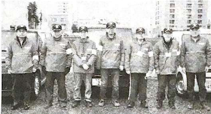
▲地区内の安全安心な暮らしを支える青パト隊員たち

令和3年度歳末「安全・安心の集い」が伏古記念館（東区伏古7条2丁目8-15）で開催されました。これは、地域の安全は地域で守るという決起大会でもあります。昨年は新型コロナで中止となり、2年ぶりの開催となりました。