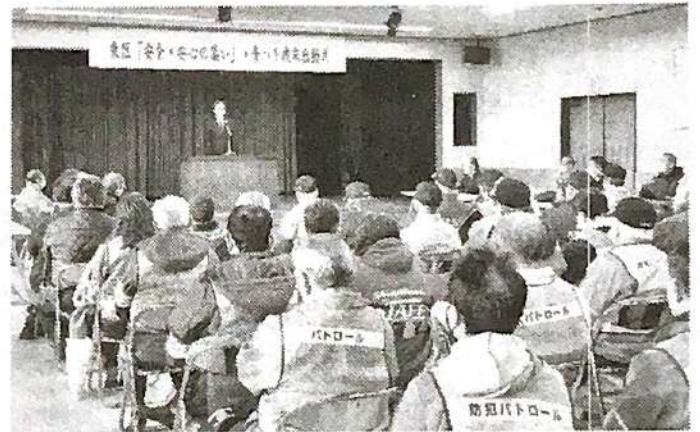
▲東区「安全・安心の集い」・青パト歳末出動式の様子

栄東地区での不審者出没などのニュースが後を絶ちません。「地域の安全は地域で守る」をモットーに、青パト隊のパトロールは続きます。