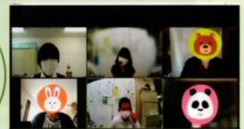
ZOOM を使用した交流の様子