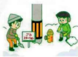
消火栓やゴミステーション 周辺の除雪