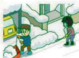
個人宅の間口除雪