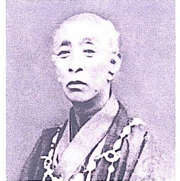
松浦武四郎（探検家） (1818-1888) 伊勢国生まれ (現在の三重県松阪市)

明治2年（1869）7月17日松浦が蝦夷地を「北加伊道」を 含む6案を政府に提案8月15日太政官布告により「北海道」と 命名された。 ※神々がやどる北のアイヌの大地という意味 アイヌ語の“カイ”とはこの地で生まれたものの事