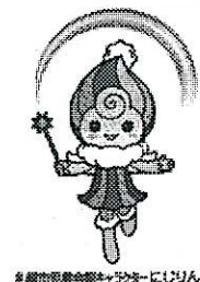
札幌市児童会館センターにじりん